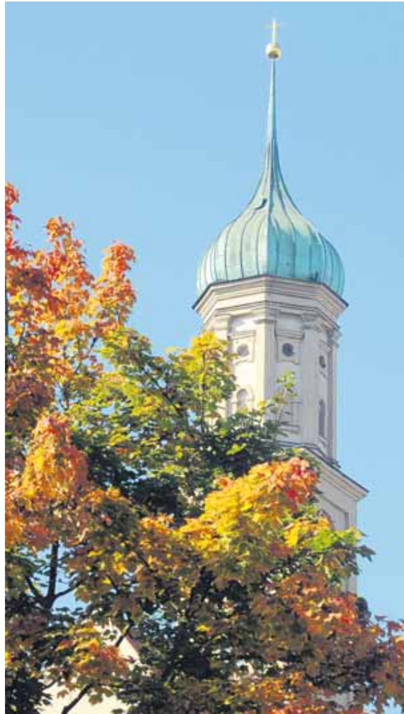
Der Kirchturm von St. Peter und Paul kontrastiert wunderbar mit dem farbenfrohen Herbstlaub der Bäume ringsum.